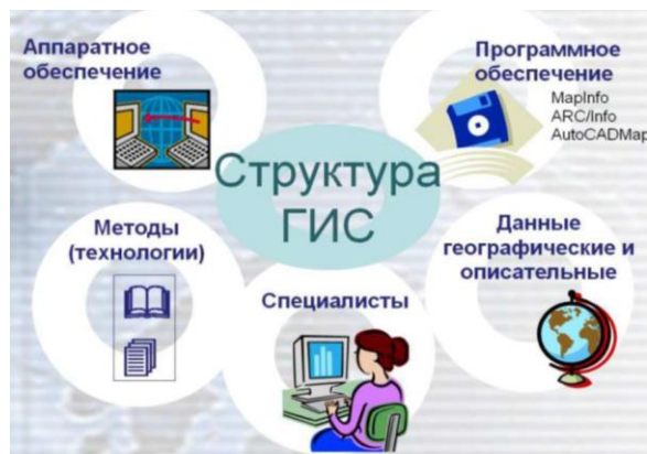
Рисунок 2. Структура ГИС

Работающая ГИС включает в себя пять ключевых компонентов: аппаратные включения, программное обеспечение, спецданные, исполнители и методы (рис.2).