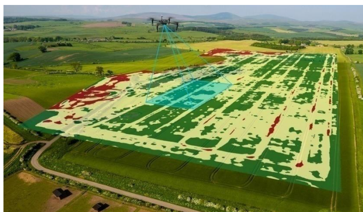
Рисунок 4. Использование беспилотников

Урожайность культур на разных участках одного поля неодинакова. На величину многоплодной урожайности влияют следующие факторы: качество почвы (плодородие, кислотность, структура); дозы и виды применяемых удобрений; рельеф местности; наличие лесополос; посевная техника, уход и уборка урожая; качество семян; болезни и вредители сельскохозяйственных культур; погодные условия и многое другое. Сравнивая определенные характеристики поля с более продуктивными картами, специалисты по сельскому хозяйству могут определить причины неравномерной урожайности (одни части поля более продуктивны, чем другие). Решение о внесении удобрений в конкретную область поля будет основано на глобальном позиционировании и ГИС, традиционных источниках информации и экспертных решениях практиков и консультантов. Зная урожайность полей, почву и другие характеристики, можно прогнозировать движение растений с помощью глобального позиционирования и ГИС, датчиков, исполнительных механизмов машин (например, для внесения удобрений) и известных полей с азотом, фосфором и др. калий. Внесите необходимое количество удобрений на каждую площадь [3]. Спрос на индустрию дронов будет продолжать расти за счет расширения сельскохозяйственного рынка - с 2,81 миллиарда долларов в 2014 году, который, по прогнозам, вырастет до 6,43 миллиарда долларов в 2022 году. Самолеты также играют важную роль в повышении производительности и прибыльности сельскохозяйственного сектора (рисунок 4).