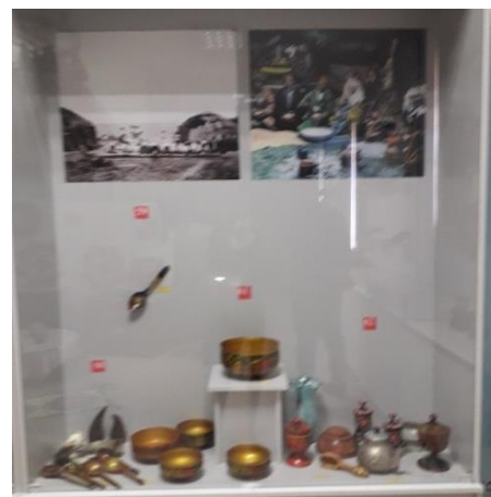
Рисунок -1,2 Фотоматериалы из рабочей поездки научно-исследовательской группы ученых ЮКУ им.М.Ауэзова. Музей средней школы с.Балдыберек, Тoleyский район.

Развитие национальных видов ремесла. В 2020-2021 году период пандемии, казахстанскому обществу заданы новые приоритеты, новые ценностно-ориентированные направления развития. Одним из важных приоритетов страны стал вопрос о сохранении нации в целом, развитие экономики страны и социальном обеспечении народа в новых условиях. Стране необходимо не потерять свою идентичность и культуру, тем более что карантинные меры, заставили общество оценить работу многих отраслей, в том числе, добычи сырья, изготовление готовой продукции, товарооборота, логистики, дефицит лекарственных препаратов и т.д. Таким же примером в изучения и популяризации истории родного края занимается администрация и молодые педагоги-исследователи сельской школы с.Балдыберек, которые параллельно с образованием ведут и научно-исследовательскую работу по сохранению национального кода, популяризации, совершенствованию социально-экономического, культурно-исторического и политического развития села.