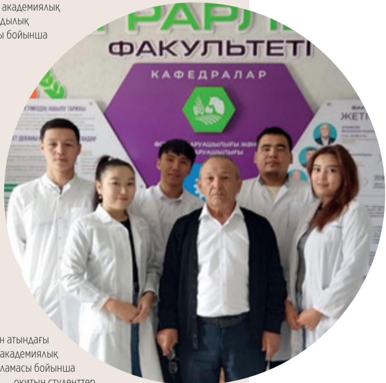
Орал қ. Жәңгір хан атындағы БҚАТУ ішкі академиялық оралымдылық бағдарламасы бойынша оқитын студенттер.