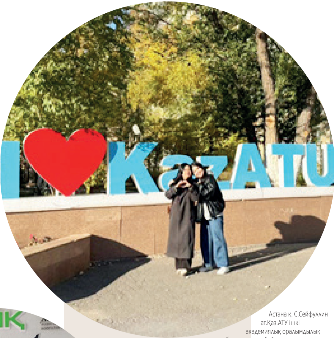
Астана қ. С.Сейфуллин ат.Қаз.АТУ ішкі академиялық оралымдылық бағдарламасы бойынша оқитын М.Әуезов ат. ОҚУ студенттері.