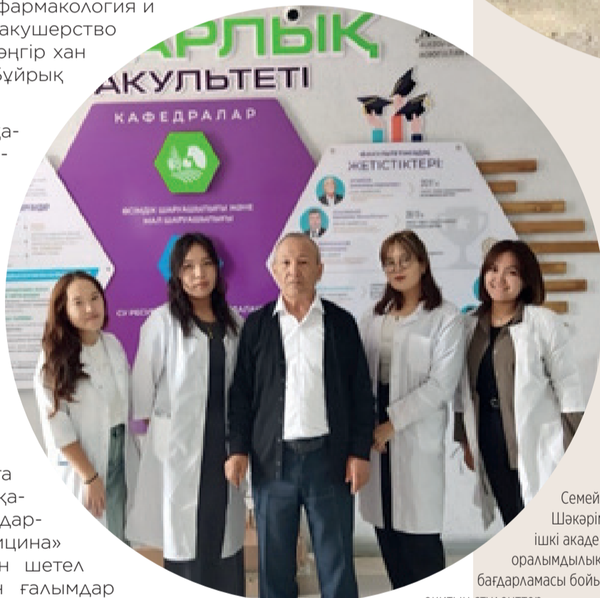
Семей қ. Шәкәрім ат.ҚАТУ ішкі академиялық оралымдылық бағдарламасы бойынша оқитын студенттер.