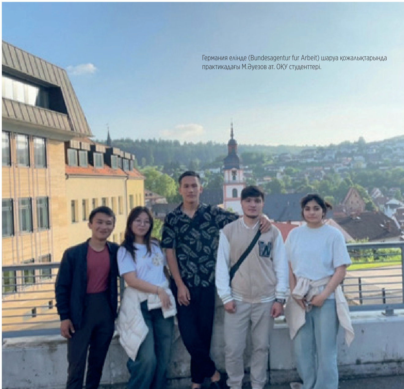
Германия елінде (Bundesagentur für Arbeit) шаруа қожалықтарында практикадағы М.Әуезов ат. ОҚУ студенттері.

Кафедрада ішкі және сыртқы академиялық ұтқырлық бағдарламасы белсенді жүргізілуде Ресей Халықтар Достығы университеті, Орлов Н.В.Парахина атындағы мемлекеттік аграрлық университеті, Оренбург мемлекеттік аграрлық университеті, Өзбекстанның Ташкент мемлекеттік аграрлық университеті, Самарқандағы мемлекеттік Ветеринарлық медицина және Биотехнология университеті, С.Сейфуллин атындағы агротехникалық университет Астана қ., "Семей қ. Шәкәрім атындағы университет" КеАҚ және Білім алушыларға арналған тәжірибеден өту туралы келісім шарт, «Logo e.v. Одағы»(шығыс Еуропадағы Ауыл шаруашылығы және экологиялық тепе теңдік) коммерциялық емес қауымдастығы жетекші ғалым-профессорларының, жоғары оқу орындарының, шаруа қожалық, мекеме мамандарының қатысуымен, кафедрада мерзімді түрде халықаралық қысқы және жазғы мектептер, ғылыми коллаборация және халықаралық ынтымақтастықты арттыру мақсатында халықаралық дөңгелек үстелдер ұйымдастырылады.