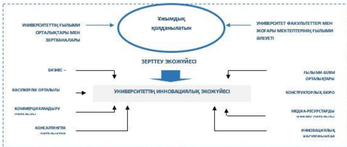
4-сурет. Бірыңғай инновациялық экожүйе

Бірыңғай инновациялық экожүйеге (4-сурет) кәсіпкерлік орталығы, ғылыми-білім беру орталықтары, бизнес-инкубатор, коммерцияландыру орталығы, инновациялық кәсіпорындар, конструкторлық бюро, нысаналы капитал қоры (эндаумент-қор), бұқаралық медиа-ресурстарды әзірлеу орталығы, кадрларды даярлау, қайта даярлау және біліктілігін арттыру орталығы, стартап-студия және технологияны, инновацияны және зияткерлік меншікті қорғауды қолдау орталығы кіретін болады.