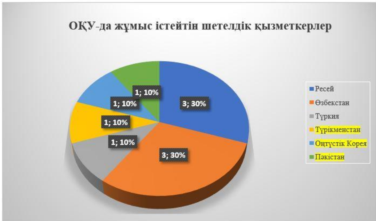
1-сурет. ОҚУ-да жұмыс істейтін шетелдік қызметкерлер (2021 - 2023 жж.)

Үш тілді немесе ағылшын тілді топтарда сабақтарды ұйымдастыру үшін шет тілін меңгерудің жалпы еуропалық құзыреттеріне сәйкес шет тілін меңгергенін растайтын халықаралық сертификаттары бар оқытушылар тартылады (IELTS (АЙЛТС); TOEFL IBT (ТОЭФЛ АЙВИТИ); TOEFL ITP (ТОЭФЛ АЙТИПИ)). Қосымша білім беру орталығы жыл сайын ОПҚ және университет тыңдаушылары үшін CLIL (КЛИЛ) технологиясы бойынша 72 сағаттық курсты ұйымдастырады және өткізеді.