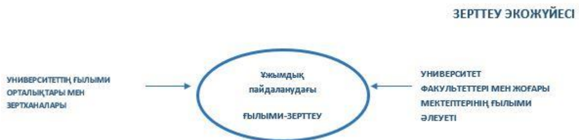
3-сурет. Зерттеу экожүйесі

Бағдарламаның идеясына сәйкес ОҚУ-да құрылған инновациялық зерттеу экожүйесінің негізгі өзегі (3-сурет) Ұжымдық пайдаланудағы ғылыми-зерттеу орталығы болады.