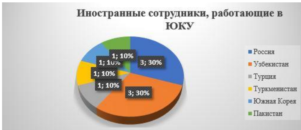
Рисунок 1- Иностранцы сотрудники, работающие в ЮКУ (2021 – 2023 гг.)

Для организации занятий в трехязычных или англоязычных группах привлекаются преподаватели, имеющие международные сертификаты, подтверждающие владение иностранным языком в соответствии с общеевропейскими компетенциями владения иностранным языком (IELTS (АЙЛТС); TOEFL IBT (ТОЭФЛ АЙБИТИ); TOEFL ITP (ТОЭФЛ АЙТИПИ)). Ежегодно Центром дополнительного образования организуется и проводится 72-х часовой курс по технологии CLIL (КЛИЛ) для ППС и слушателей университета.