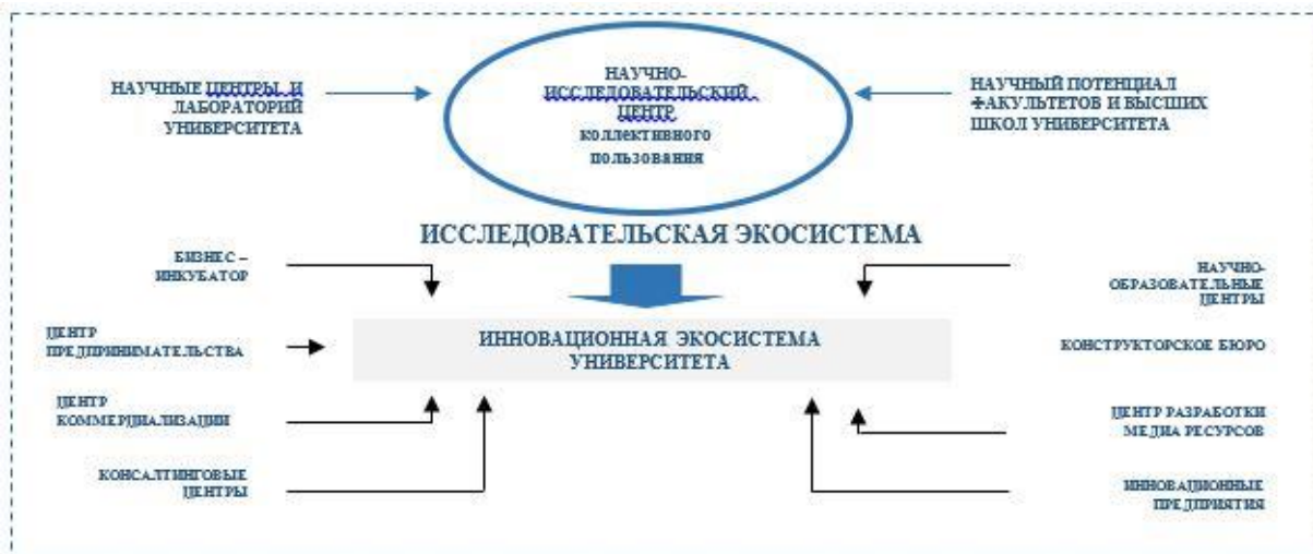
Рисунок 4. Единая инновационная экосистема

Созданная исследовательская экосистема будет интегрирована с существующей исследовательской и инновационной экосистемой университета. В ходе интеграции будет модернизирована и реорганизована существующая и создана единая инновационная исследовательская экосистема, которая составит основу исследовательского университета.