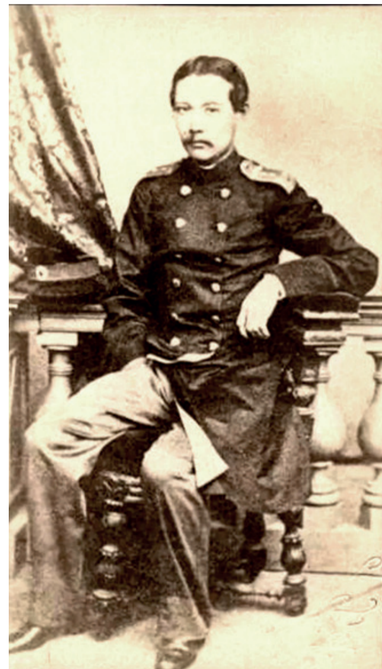
Фото Ш.Уалиханова. Борель. Санкт-Петербург.

вал Заука, мимо озера Чатыркуля в г.Кашгар. Господин Валиханов не успел издать всех результатов своего путешествия., он напечатал только несколько статей, которые впрочем, имеют важный научный интерес, и обличают широкое образование и редкую наблюдательность в авторе, киргиз по происхождению, он прекрасно знал туземные языки и, разумеется, лучше чем кто-либо, мог собрать от туземцев самые разнообразные и полные сведения, поэтому несомненно, что результаты его были бы весьма плодотворны, если бы он не умер, вскоре после возвращения из Кашгара, ему принадлежит несколько статей, из которых последняя напечатана была почти через 10 лет после его смерти П.П.Семеновым. Первая из них имеет больше интерес исторический, нежели географический, а потому при всем их значении мы не будем останавливаться на них, замеили только что, проходя поперек всего Тянь-Шаня от перевала Заука, следовательно, продолжал путь Семенова, он собрал коллекцию горных пород, встречающихся на этом пути, также куски нефрита, добываемого в горе Мирджай около Яркенда и в реке Каракаш, болорские яшмы, мрамор, хрусталь, песчаное золото с реки Керия. К сожалению эта редкая коллекция где-то затерялась, не будучи обработана, по крайней мере, всемои поиски за ней оказались тщетными. При описании Алтышара господин Валиханов, между прочим, кратко сообщает о нахождении различных минеральных продуктов, которые, хотя еще очень мало исследованы, тем не менее известно, что золото вымывается в селеньи Карья